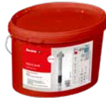
Eimer Bolzenanker FAZ II