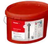
Eimer Bolzenanker FAZ II R