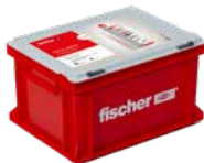
Handwerkerkoffer groß Montagemörtel FIS VL 360 S