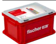
HWK Hochleistungsmörtel FIS V Plus 360 S