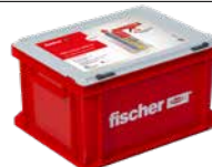
HWK Hochleistungsmörtel FIS V Plus 360 S inkl. FIS DMS