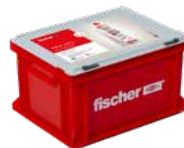
Handwerkerkoffer groß Montagemörtel FIS VL 300 T