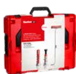
L-BOXX 102 DuoLine